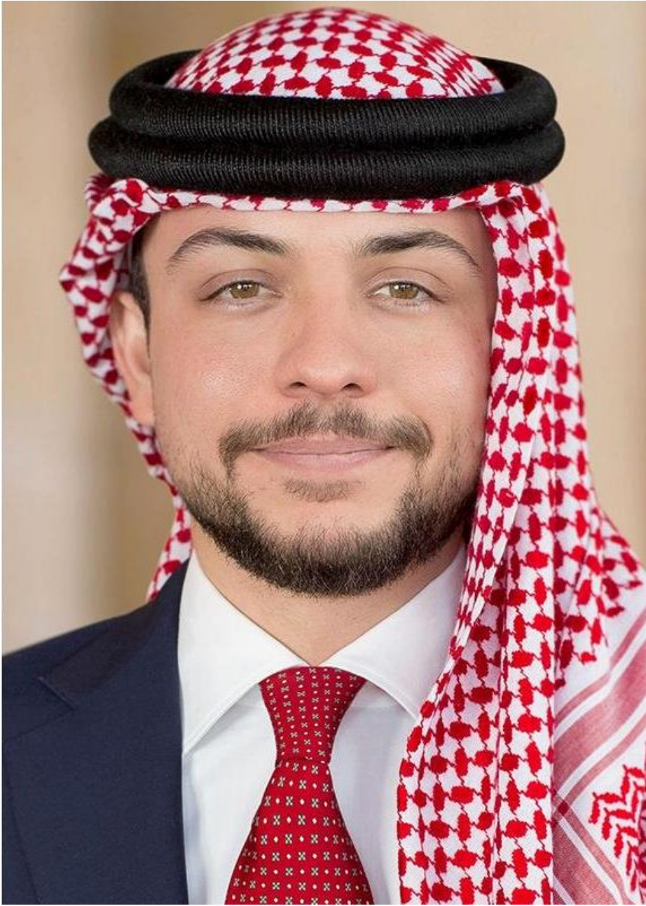
صاحب السمو الملكي الأمير حسين بن عبد الله الثاني ولي العهد المعظم