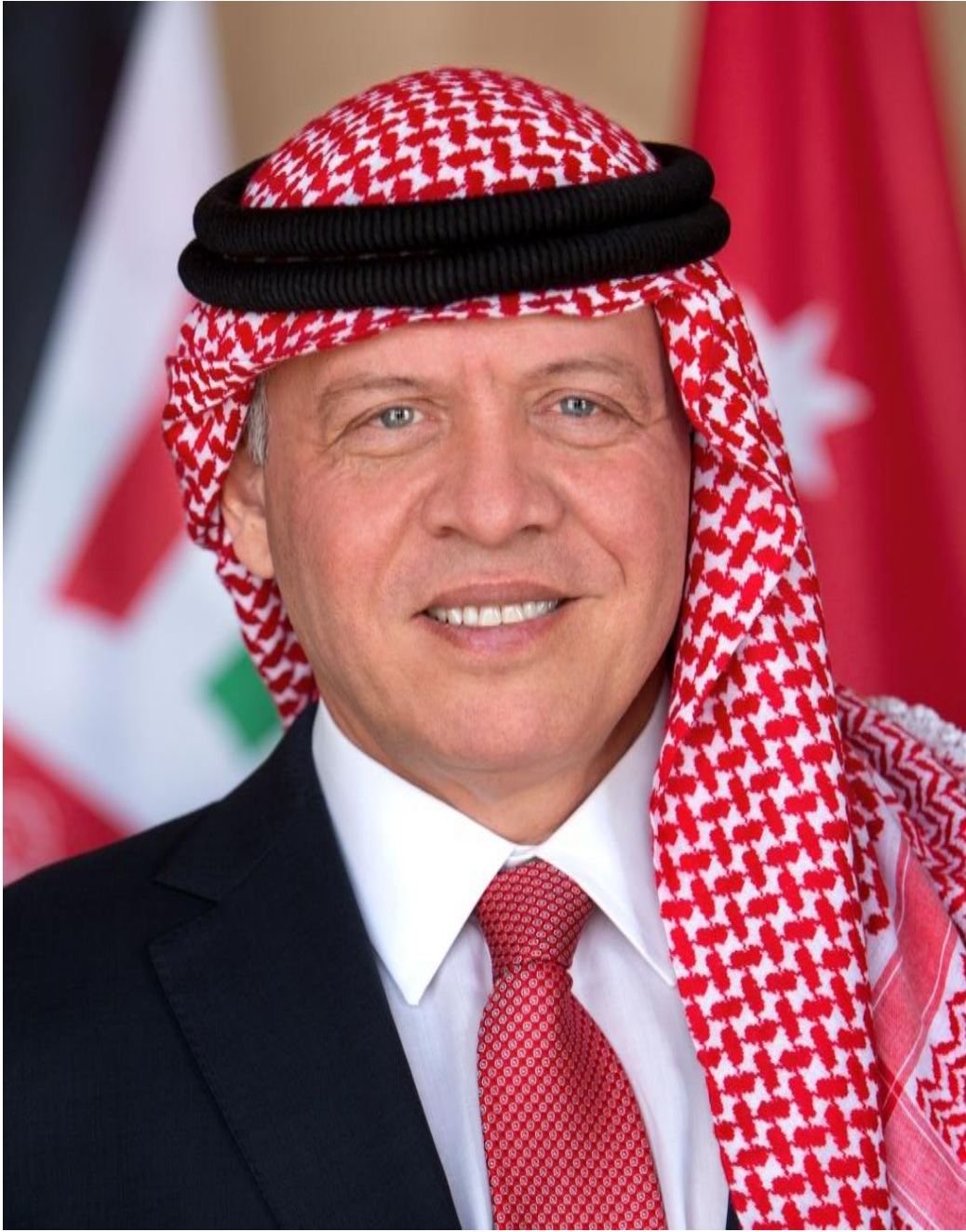
حضرة صاحب الجلالة الهاشمية الملك عبد الله الثاني ابن الحسين المعظم