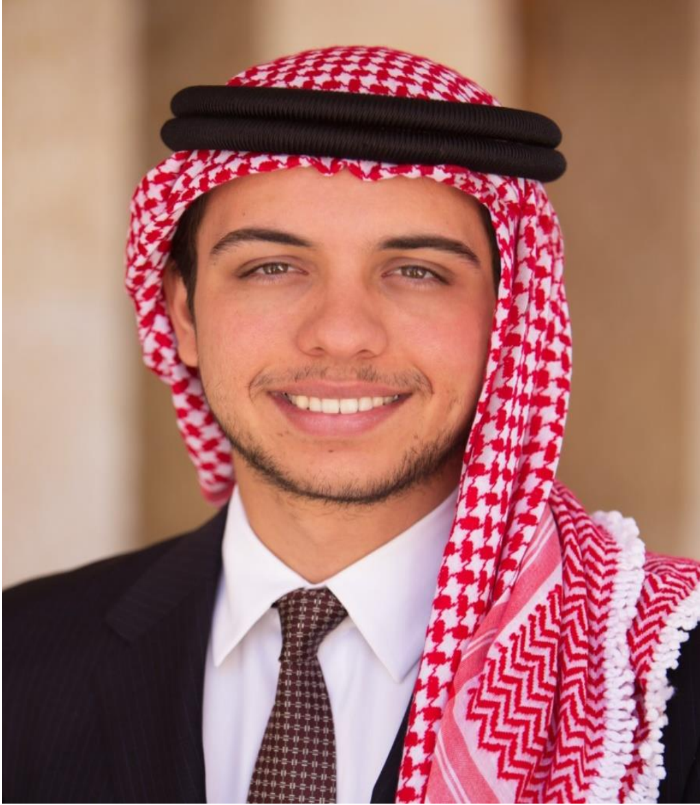
صاحب السمو الملكي الأمير حسين بن عبد الله الثاني ولي العهد المعظم