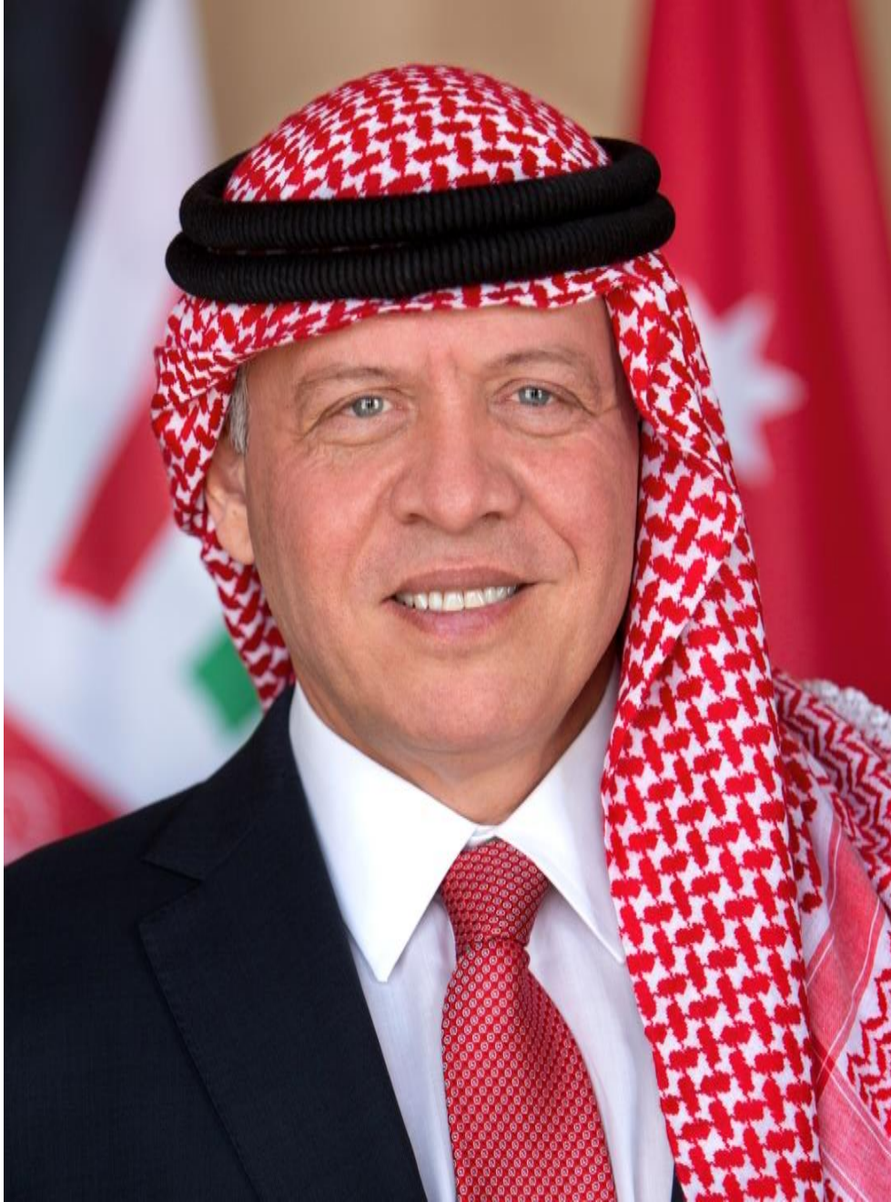
حضرة صاحب الجلالة الهاشمية الملك عبد الله الثاني ابن الحسين المعظم